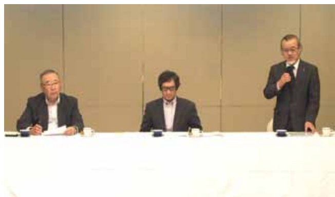
(写真は東海ブロック会議)

議事に入り、推進機構関連は、岡本代表幹事から配布資料に基づき最近の着実な進展について報告があり、活発な質疑応答があった。各支部からの支部活動報告のあと、本部事務局から東海ブロック各支部の会員数推移、支部予算の着実な実行について、代議員選挙公示に関する確認、オプティカルアワード計画の件、地区眼科医会との関係、生涯教育アンケート結果などの報告があった。