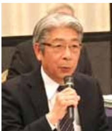
報告する日本眼鏡士連盟 神田事務局長