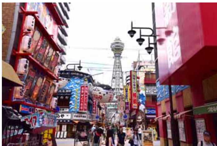
大阪市・新世界 通天閣